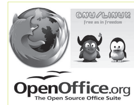
Irudia artikulu honetarako egina. Bertako irudi guztiak dute euren jabeen copyrighta.

Zentzu komunitario horren ildotik, aipatzekoak dira software librea euskaraz izateko eginiko ahaleginak. Hainbatek musu-truke – eta askotan musu-truke ere ez – eginiko lanagatik, gaur egun denok daukagu aukera euskarazko Mozilla Firefox nabigatzailearen bertsioa Euskarbar (hiztegi tresna aparta) eta guzti erabiltzeko, Windows -en ordez Linux , Ubuntu edo Eduubuntu moduko sistema eragileak jarduteko edo Microsoft Office -en ordez OpenOffice suite bulegotikoa edo Google -en tresnak baliatzeko.